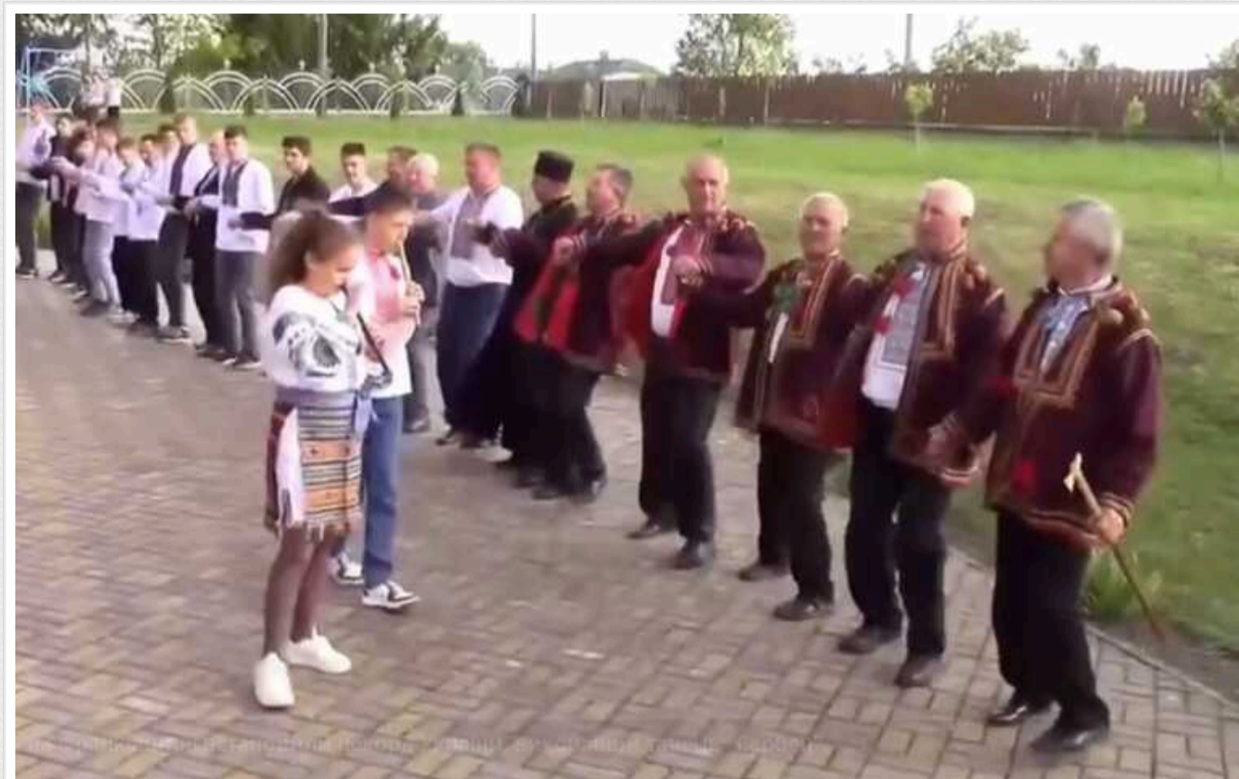
225 чоловіків із села Чортовець на Франківщині встановили рекорд України, виконавши танець «Сербен»

Так, утворивши живий ланцюг довжиною більше 2 км, вони відзначили Провідну неділю.