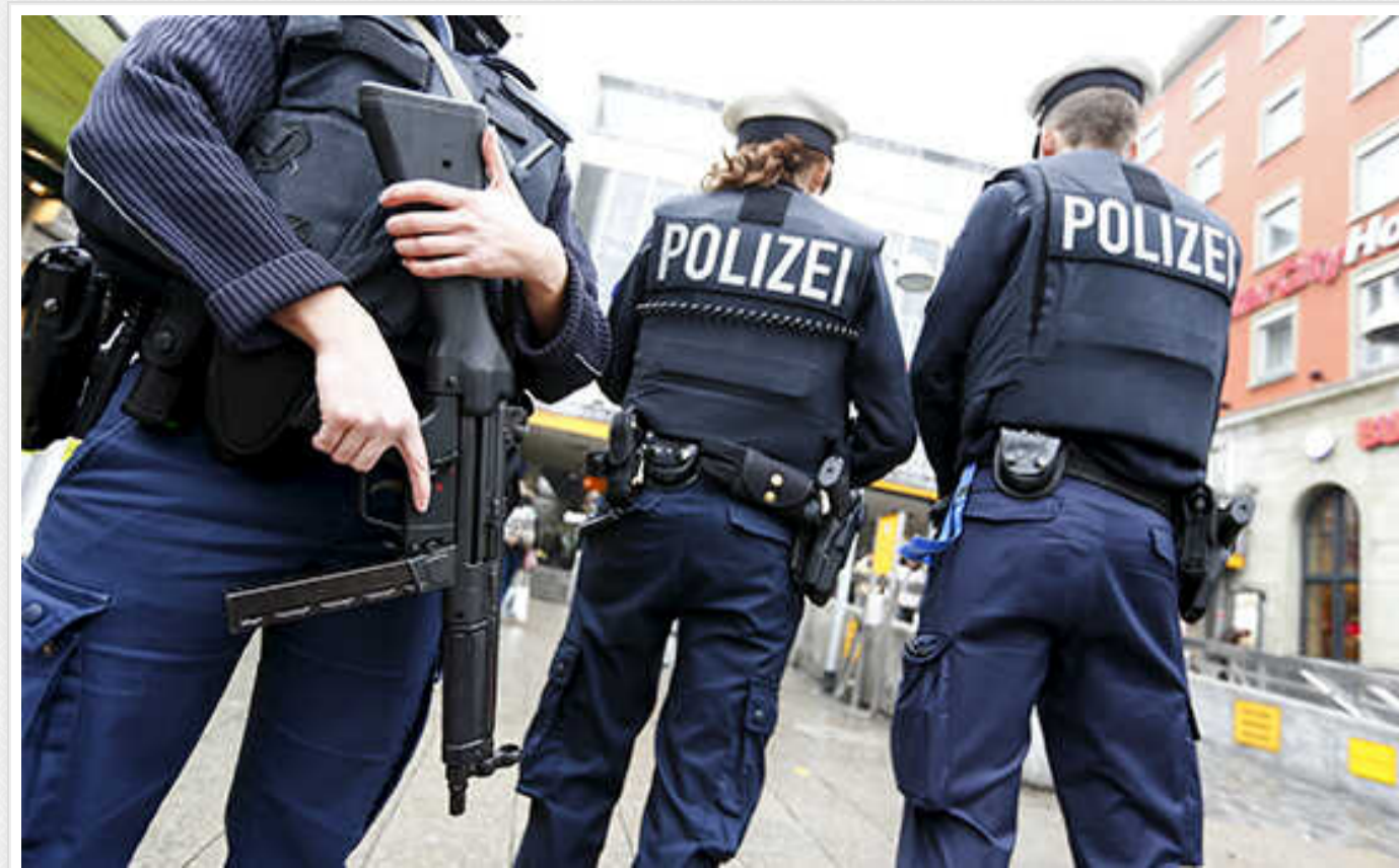
У столиці Німеччини сталися сутички після пропалестинської демонстрації

У Берліні напередодні увечері після мирної демонстрації з нагоди "Дня Накба", який відзначають араби, сталися сутички в районі Нойкельн.