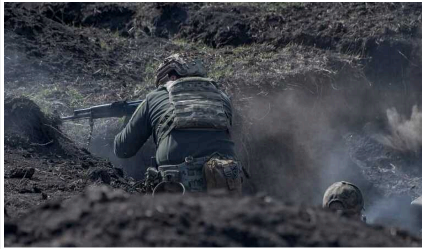
На Харківському напрямку загарбники продовжують атаки на Липці та Вовчанськ, – Генштаб

Бої йдуть на напрямках Глибоке – Липці, Лук'янці – Слобожанське, Пильна – Слобожанське, Муром – Стариця, Плетенівка – Вовчанськ.