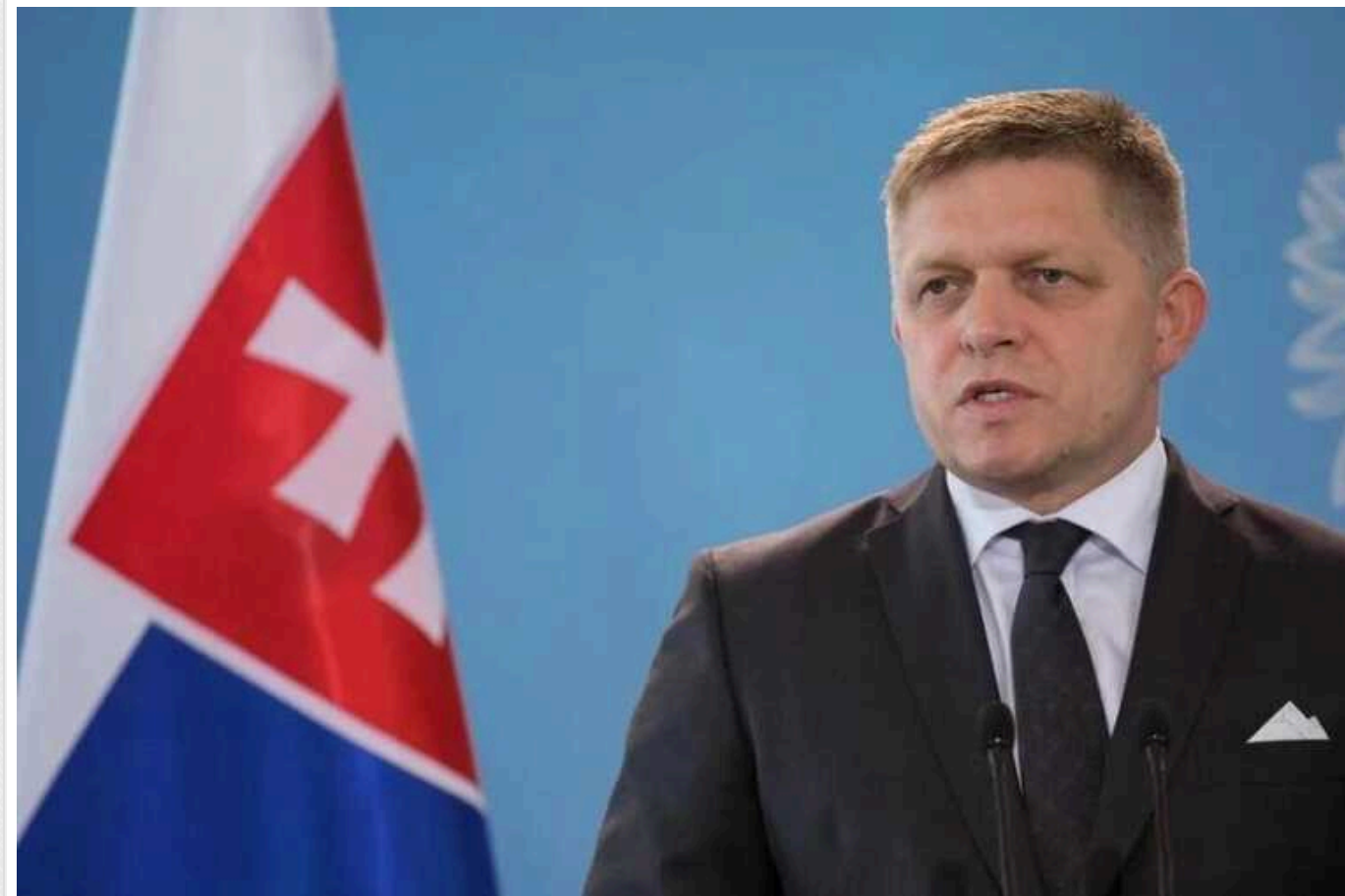
Прем'єр Словаччини Фіцо, якого вчора тяжко поранили, передбачав замах на урядовців

10 квітня він опублікував у Facebook заяву, де дорікнув опозиції та лояльним до неї ЗМІ у розпалюванні ненависті проти влади.