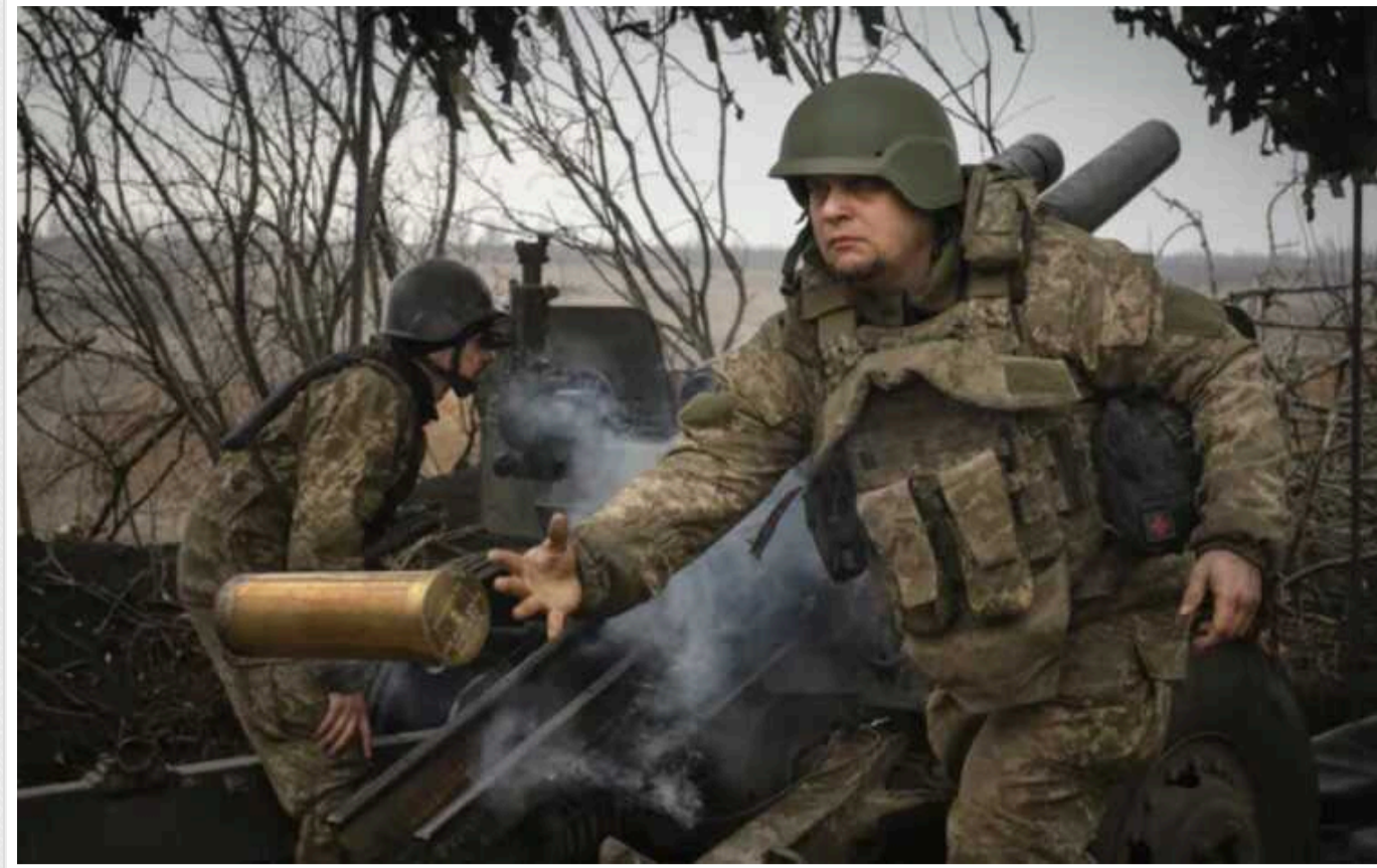
Загарбники просунулися не більше ніж на 8 кілометрів від кордону на півночі Харківщини, – ISW

Аналітики Інституту вивчення війни оцінюють, що російські окупанти просунулися не більше ніж на 8 кілометрів від кордону в північній частині Харківської області та мають намір створити "буферну зону", а не просуватися вглиб Харківщини.