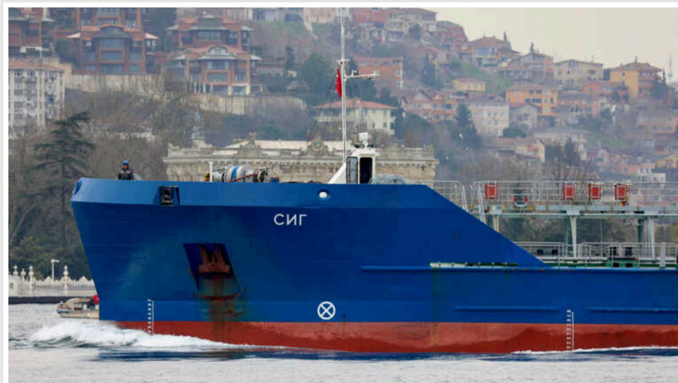
РФ переправляє через Туреччину в Євросоюз величезні обсяги нафти, – ЗМІ

Через лазівку в західних санкціях Туреччина перемарковує російську нафту, видаючи її за свою, і відправляє до Євросоюзу, завдяки чому РФ заробила €3 мільярди.