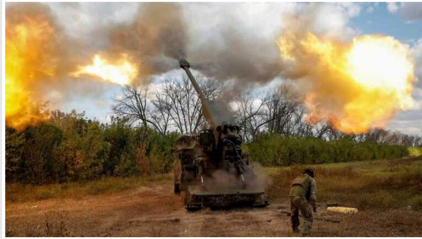
Війна РФ проти України вбила 456 українських атлетів національного рівня

Про це повідомив виконавач обов'язків міністра молоді та спорту України Матвій Бідний.