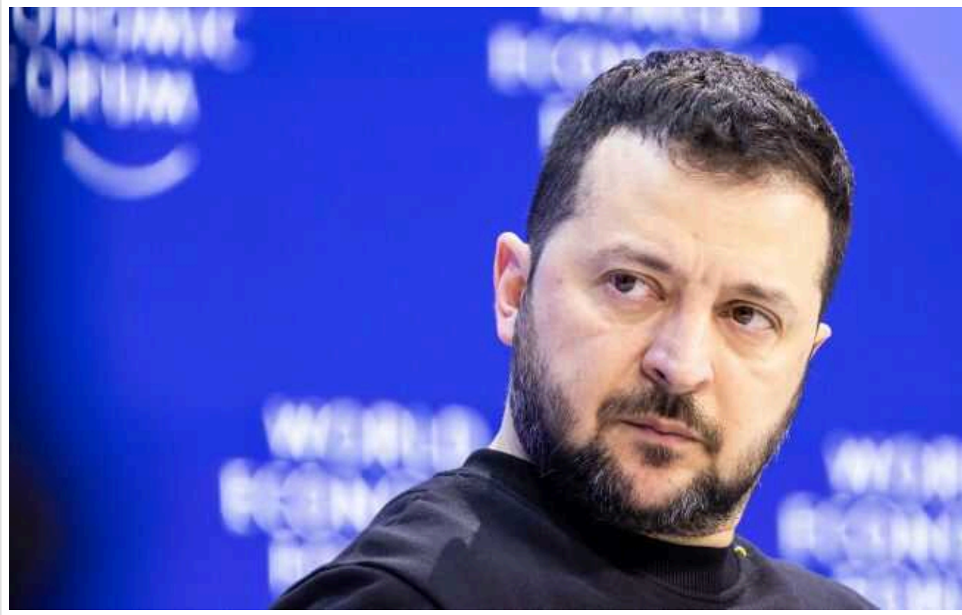
CNN: Американська розвідка спостерігає посилення дезінформації проти Зеленського

Розвідка Сполучених Штатів Америки виявила, що росіяни посилити кампанію щодо дезінформації проти Президента України Володимира Зеленського.