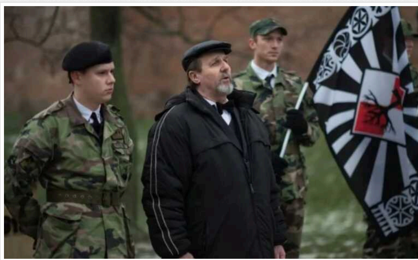
Замах на Фіцо: підозрюваний може бути пов'язаний із проросійською організацією