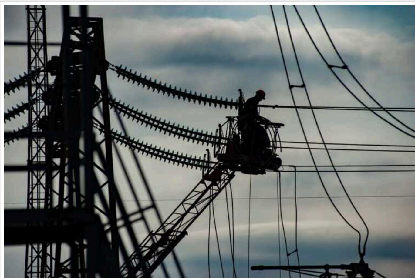
У Києві відключення світла буде по 4 години

У Києві завтра, 16 травня, введуть графіки відключення світла.