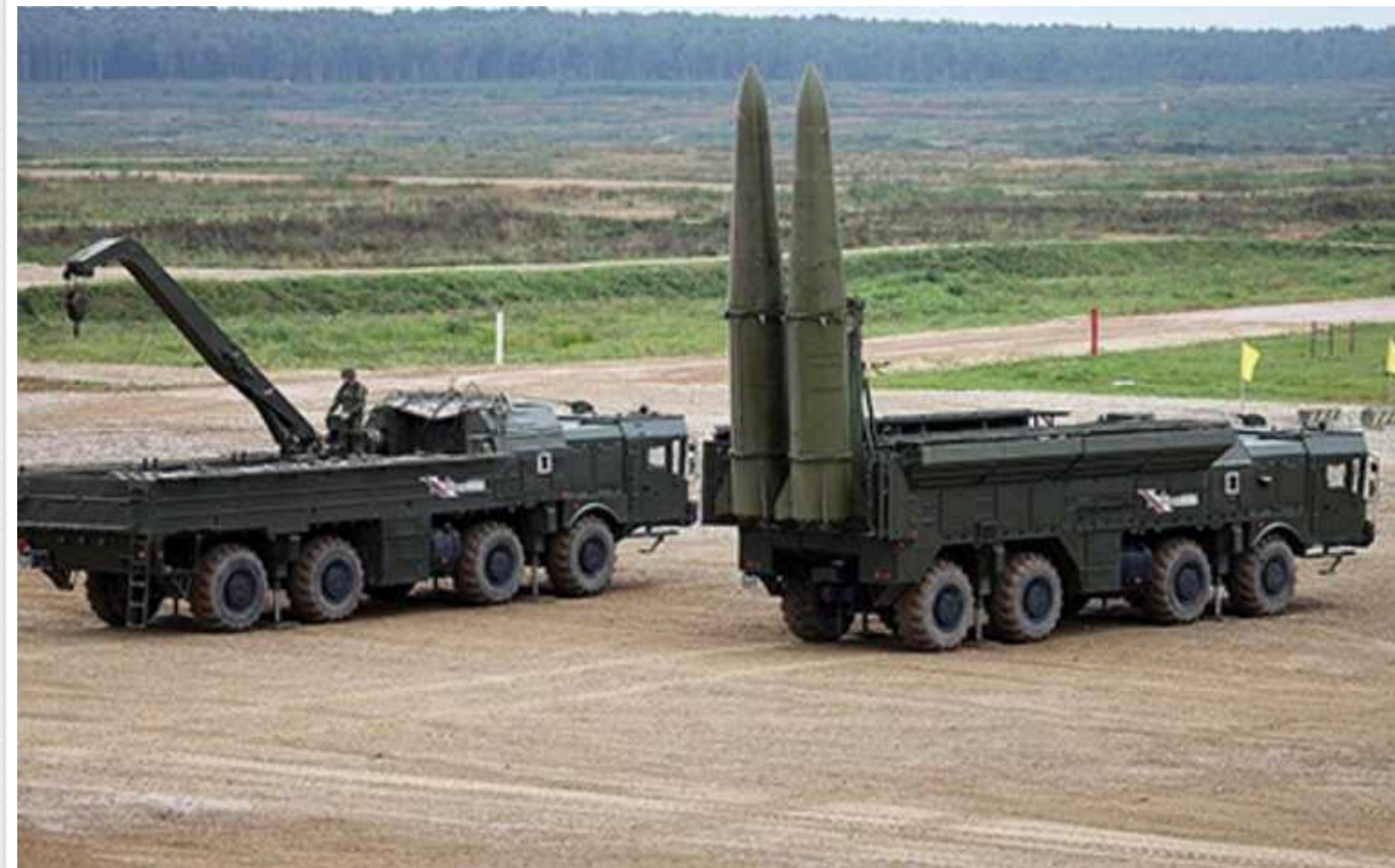
РФ почала завдавати ударів у стилі HIMARS, перспектива похмура, – Business Insider

Тепер Росія навчилася бити прицільно та скоординовано, маючи дані з безпілотників.