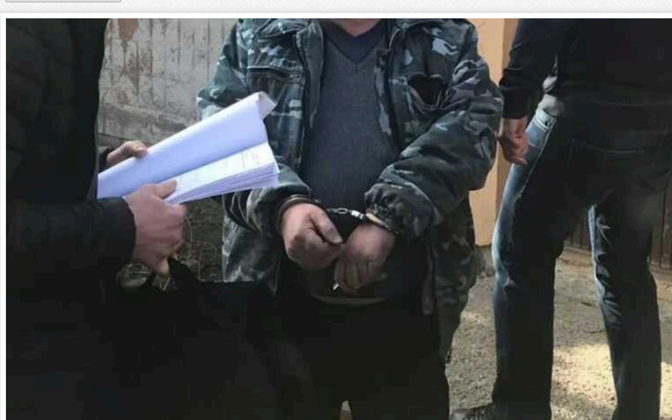
СБУ на Вінниччині затримала рецидивіста, який намагався створити мережу інформаторів

На Вінниччині затримали чоловіка, якого підозрюють у співпраці з російською приватною військовою компанією "Вагнер". Фігуранта ще у 2014 році було засуджено до в'язниці як дезертира та зрадника. Відсидівши один строк, тепер 28-річний чоловік під загрозою довічного ув'язнення.