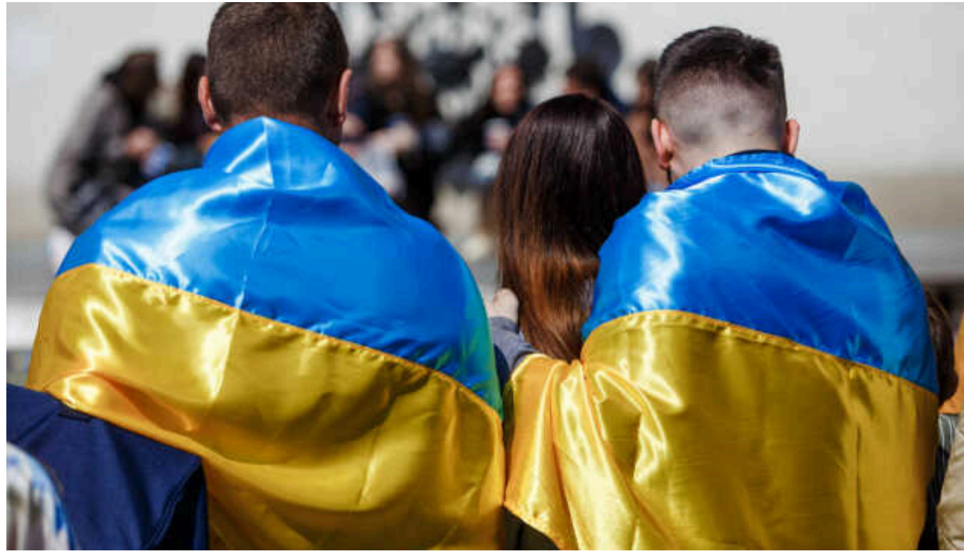
Лише 56% українців, які живуть у Польщі, Чехії та Німеччині цікавляться подіями та ситуацією в Україні

Про це свідчать результати опитування КМІС.