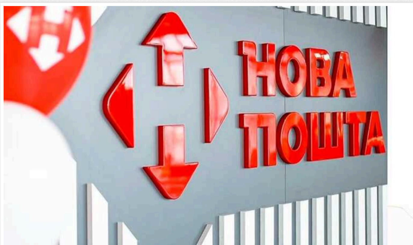
Як «Нова пошта» заробляє на гігантських потоках контрабанди цигарок

Знаєте що є «наріжним каменем» будь-якої товарної злочинної схеми? Її величність «Логістика».