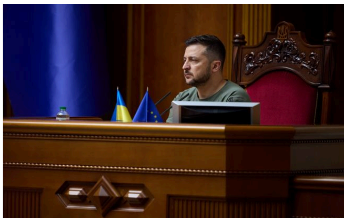
Фото: Володимир Зеленський, президент України (president.gov.ua)