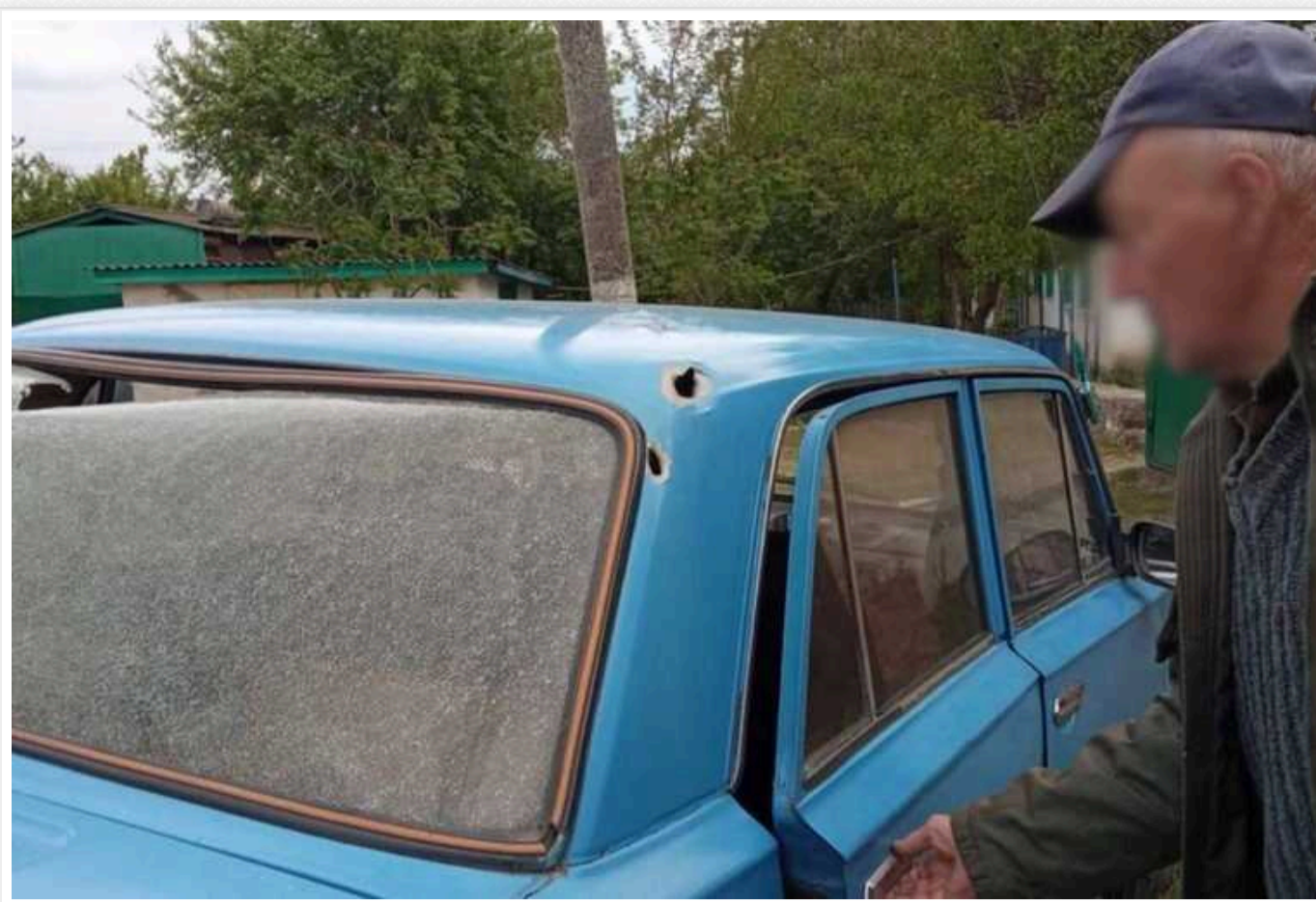
Окупанти завдали удару з артилерії по Олександрівці на Харківщині

Унаслідок російських артилерійських ударів по селу Олександрівка на Харківщині пошкоджено цивільні об'єкти.