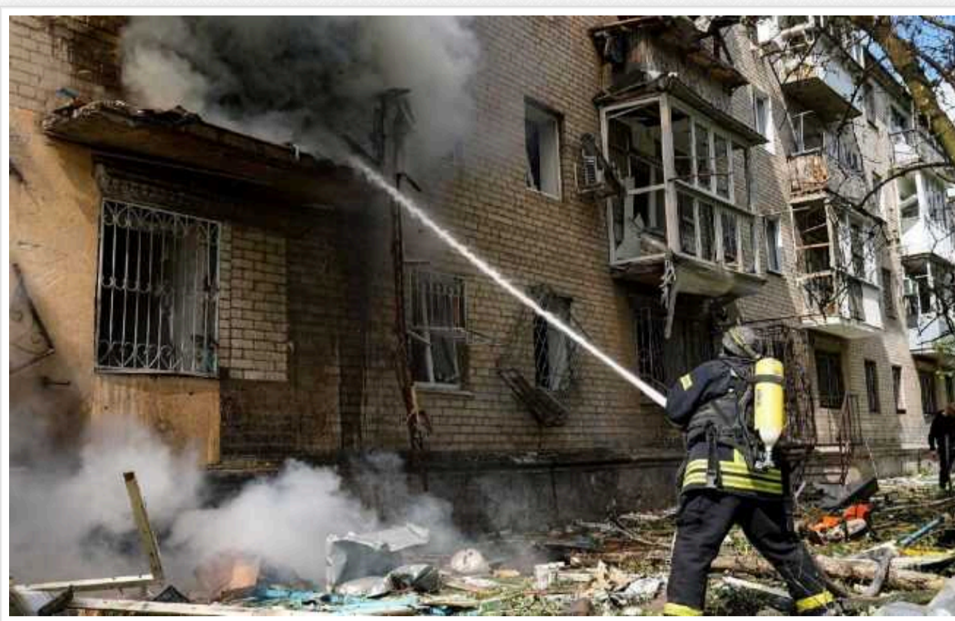
Атака по центру Херсона: кількість постраждалих збільшилась до 20

Російські війська сьогодні вдень, 15 травня, обстріляли центр Херсона з авіації. Постраждали 19 людей, серед них є підліток. Також пошкоджені зазнали багатоповерхові будинки.