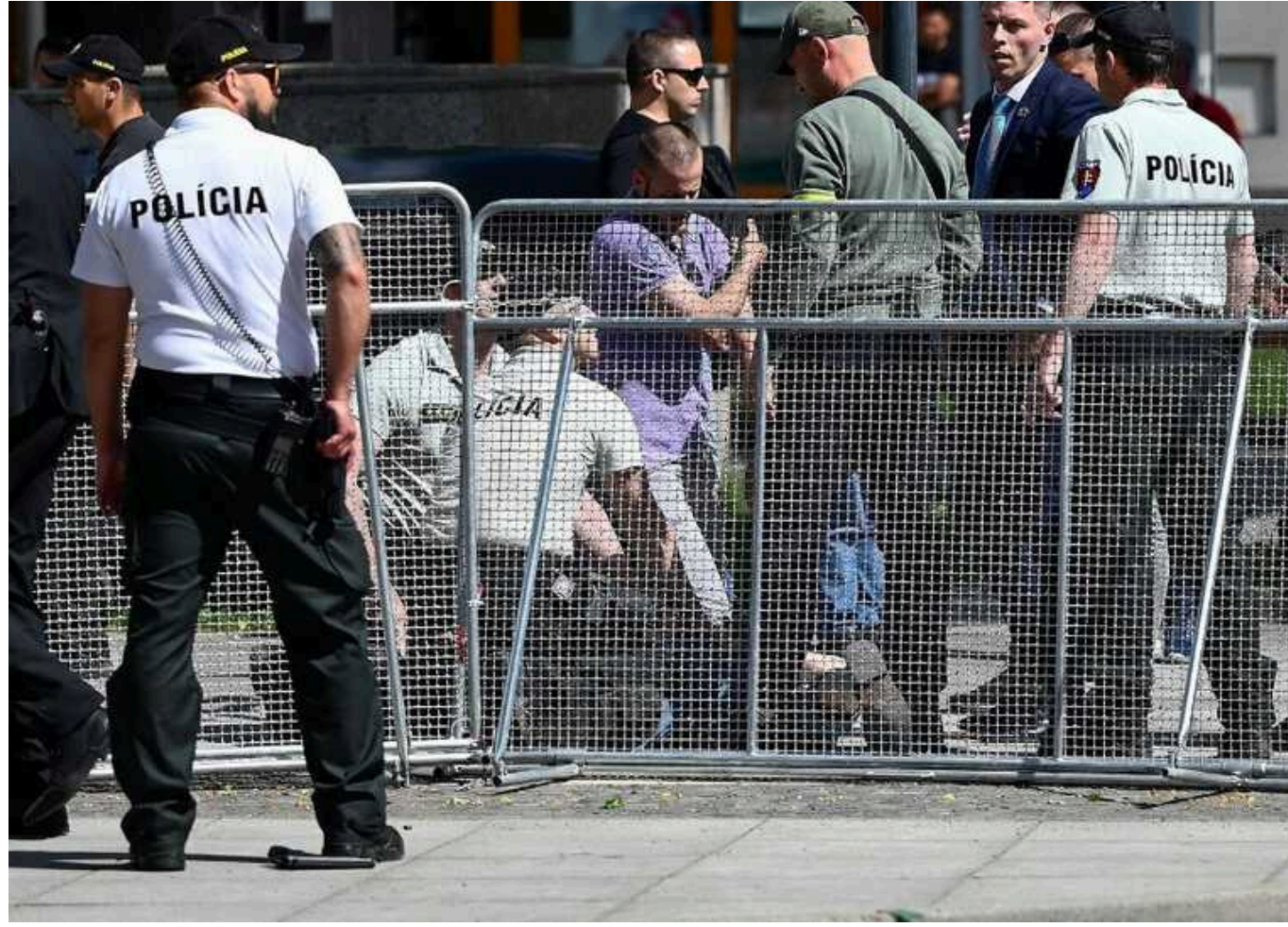
Перед замахом на словацького прем'єра Фіцо підозрюваний крикнув йому "Робо, йди сюди!" та відкрив вогонь, - ЗМІ