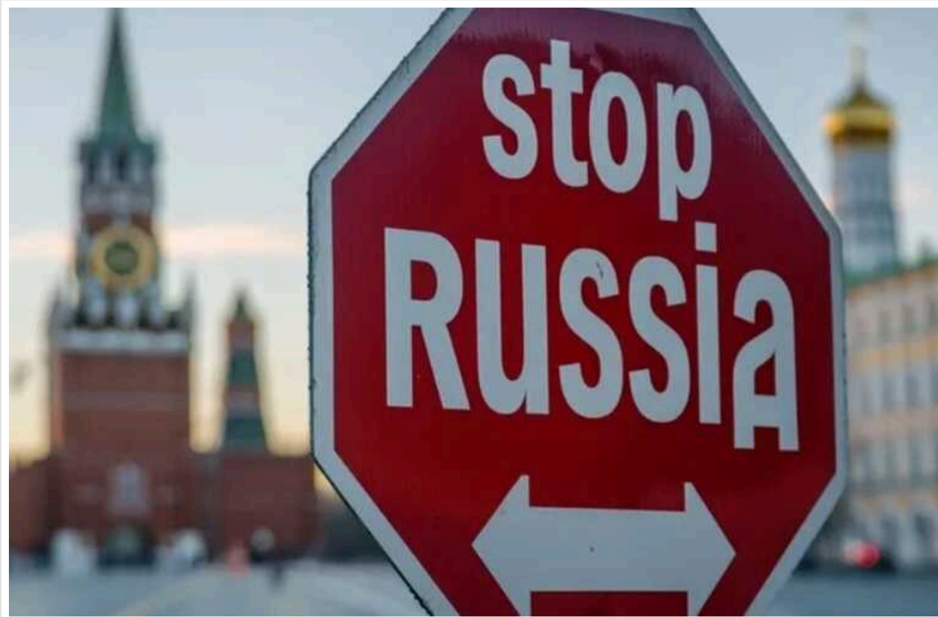
Reuters: В ЄС заговорили про жорсткі санкції проти банків, які співпрацюють з РФ

Франція та Нідерланди вимагають від Європейського Союзу санкцій проти будь-яких фінансових установ, які допомагають російським збройним силам оплачувати товари чи технології для виробництва зброї. Ця ініціатива стане черговим кроком у зусиллях стримати Росію від подальшої військової агресії та обігрування санкцій.