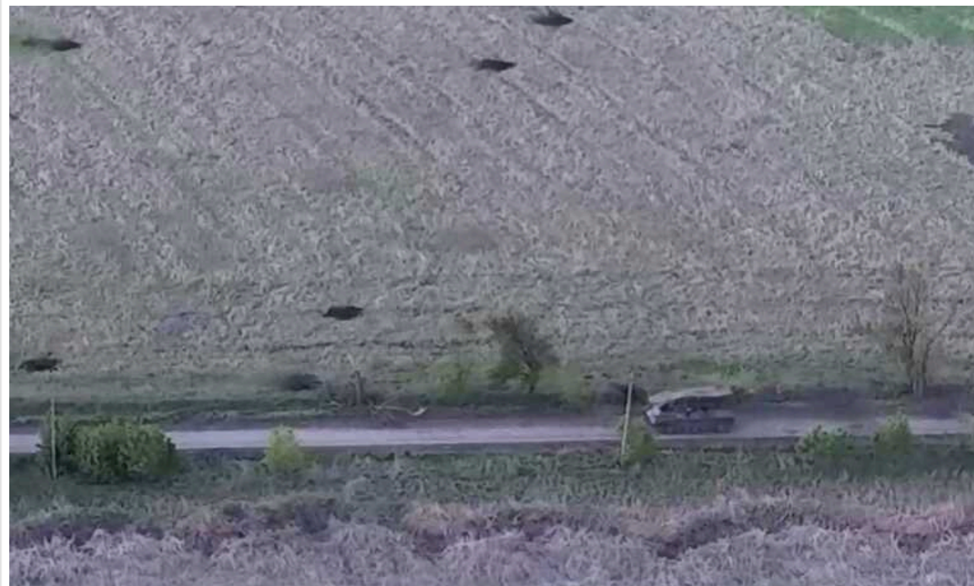
ЗСУ під Авдіївкою влаштували засідку і перебили всіх загарбників

Українські Сили оборони знищили російських окупантів, які потрапили у засідку поблизу Авдіївки Донецької області.