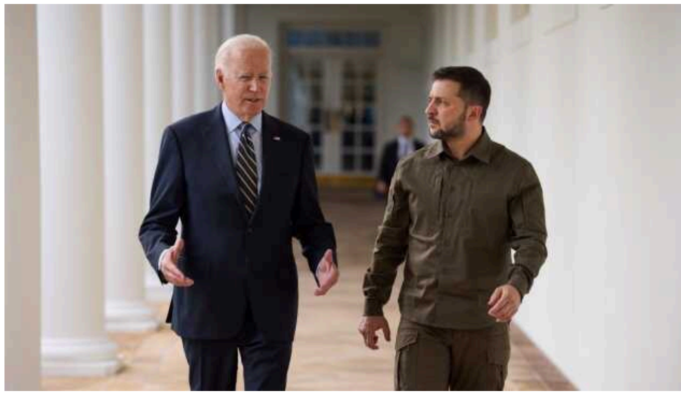
Блінкен: Байден і Зеленський можуть найближчими тижнями провести зустріч

Президент України Володимир Зеленський та його американський колега Джо Байден можуть провести зустріч протягом найближчих тижнів.