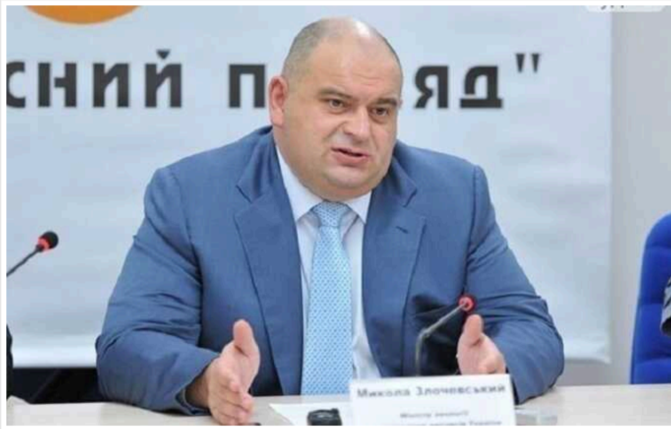
Український ексміністр Злочевський витратив 435 мільйонів гривень на житло в Дубаї

Оголошений у розшук ексміністр екології та природних ресурсів України Микола Злочевський володіє двома розкошними апартаментами у одному з елітних житлових комплексів Об'єднаних Арабських Еміратів (ОАЕ). Нерухомість він купив за $11 млн майже одразу після Революції гідності.