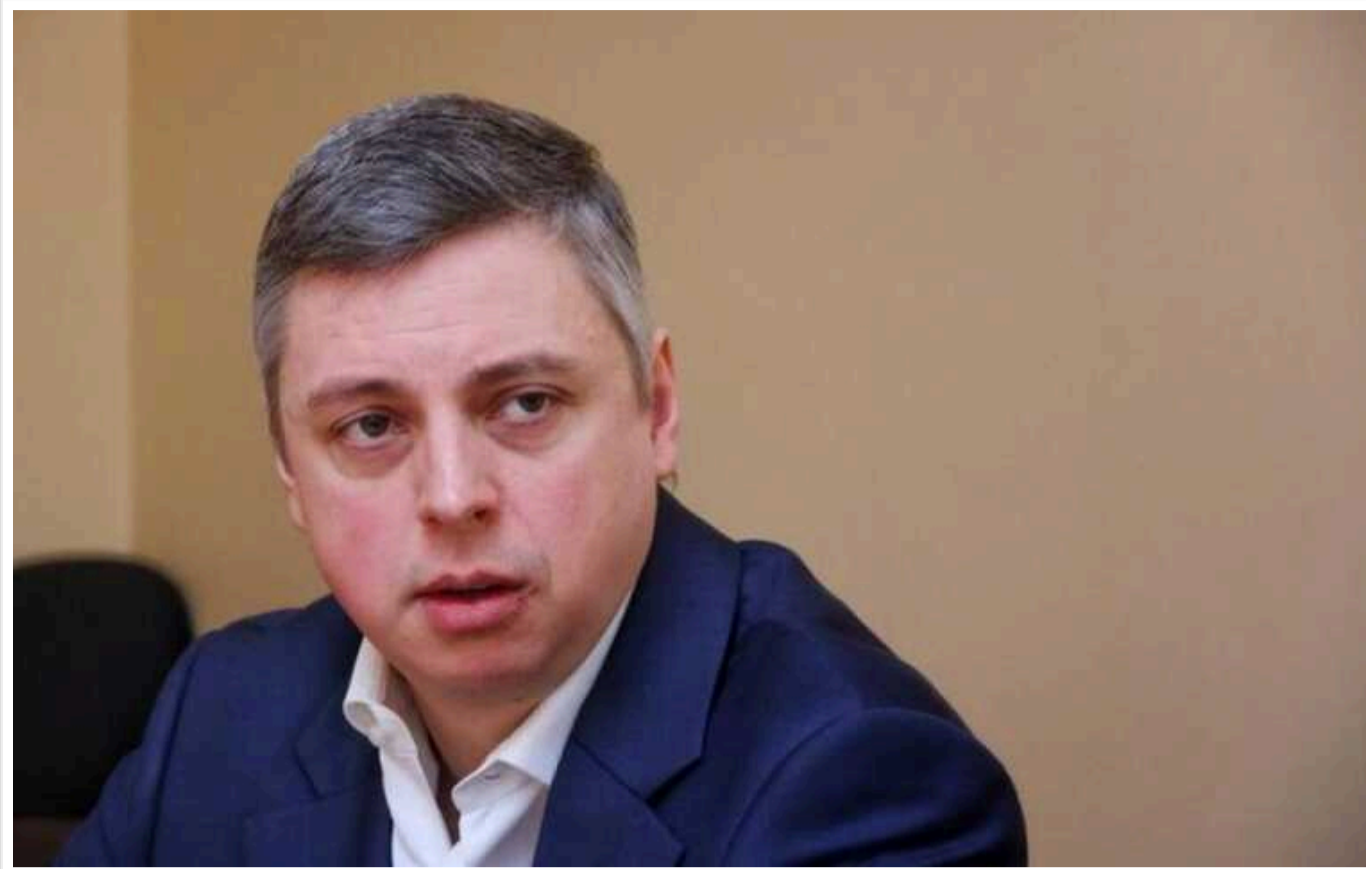
Родичам померлого співвласника ринку «7 км» Віктора Добрянського, якого підозрювали у відмиванні доходів, повернули 360 тисяч доларів та Maybach

Родичам померлого колишнього співвласника промтоварного ринку «Сьомий кілометр» на Одещині Віктора Добрянського, котрого підозрювали у відмиванні коштів та інших злочинах, повернули арештоване майно через рік після інформації про його смерть. Про це дізналися з ухвали Приморського суду, яку підготував суддя Анатолій Дерус.