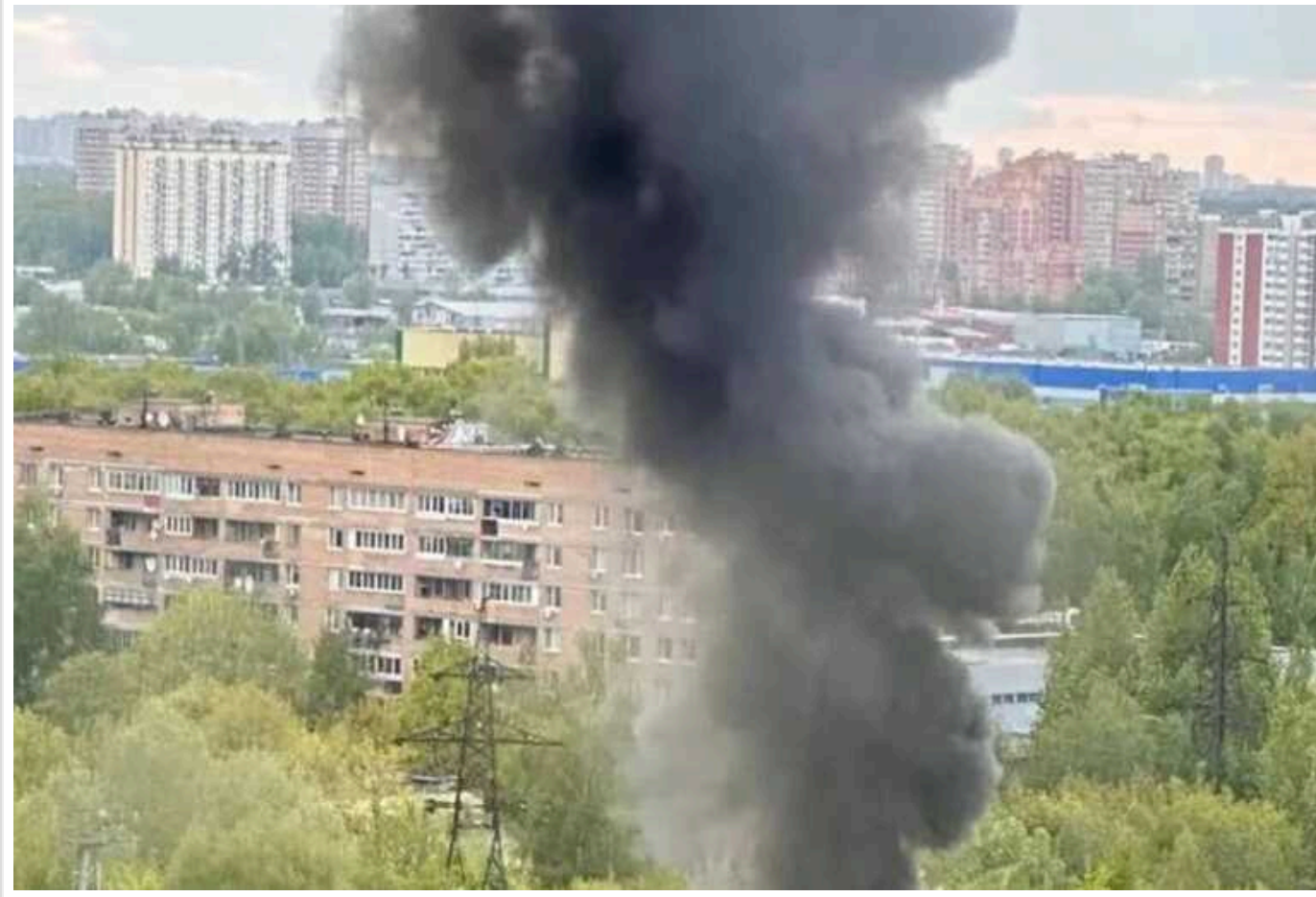
У РФ у Підмосков'ї горіла електростанція військової частини ФСБ та заводу з виробництва військового обладнання

У російському Підмосков'ї ввечері 14 травня спалахнула пожежа на електростанції військової частини ФСБ та заводу з виробництва військового обладнання "Прогрес". Причиною пожежі стало нібито коротке замикання.