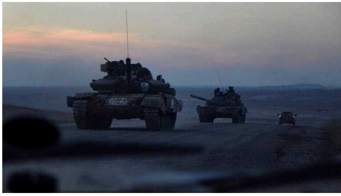
Окупанти роблять спроби закріпитися на північних околицях Вовчанська, - Deep State

Паблік Deep State повідомляє, що росіяни роблять спроби закріпитися на північних околицях Волчанська з метою подальшого просування та заняття населеного пункту.