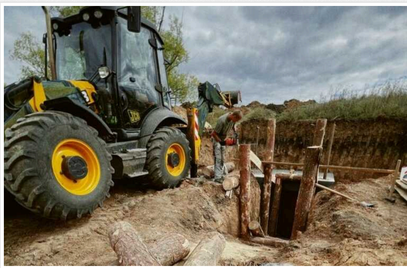
Мільйони на укрпрайони Харківщини «зливалися» підставним фірмам

У ОВА уклали прями договори на деревину для фортифікацій із фірмами, власники яких навіть знають, що вони заробляють мільйони.