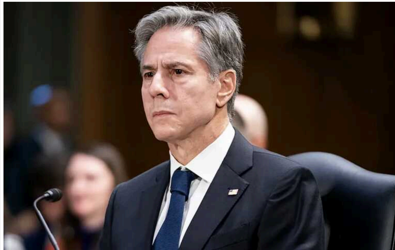
Блінкен у Києві заявив про необхідність мобілізації: «Військовим треба відпочити»

Під час свого візиту до Києва 14 травня державний секретар США Ентоні Блінкен наголосив на необхідності проведення мобілізації в Україні. За його словами, це сприятиме зміцненню оборонних можливостей країни як зараз, так і у майбутньому.