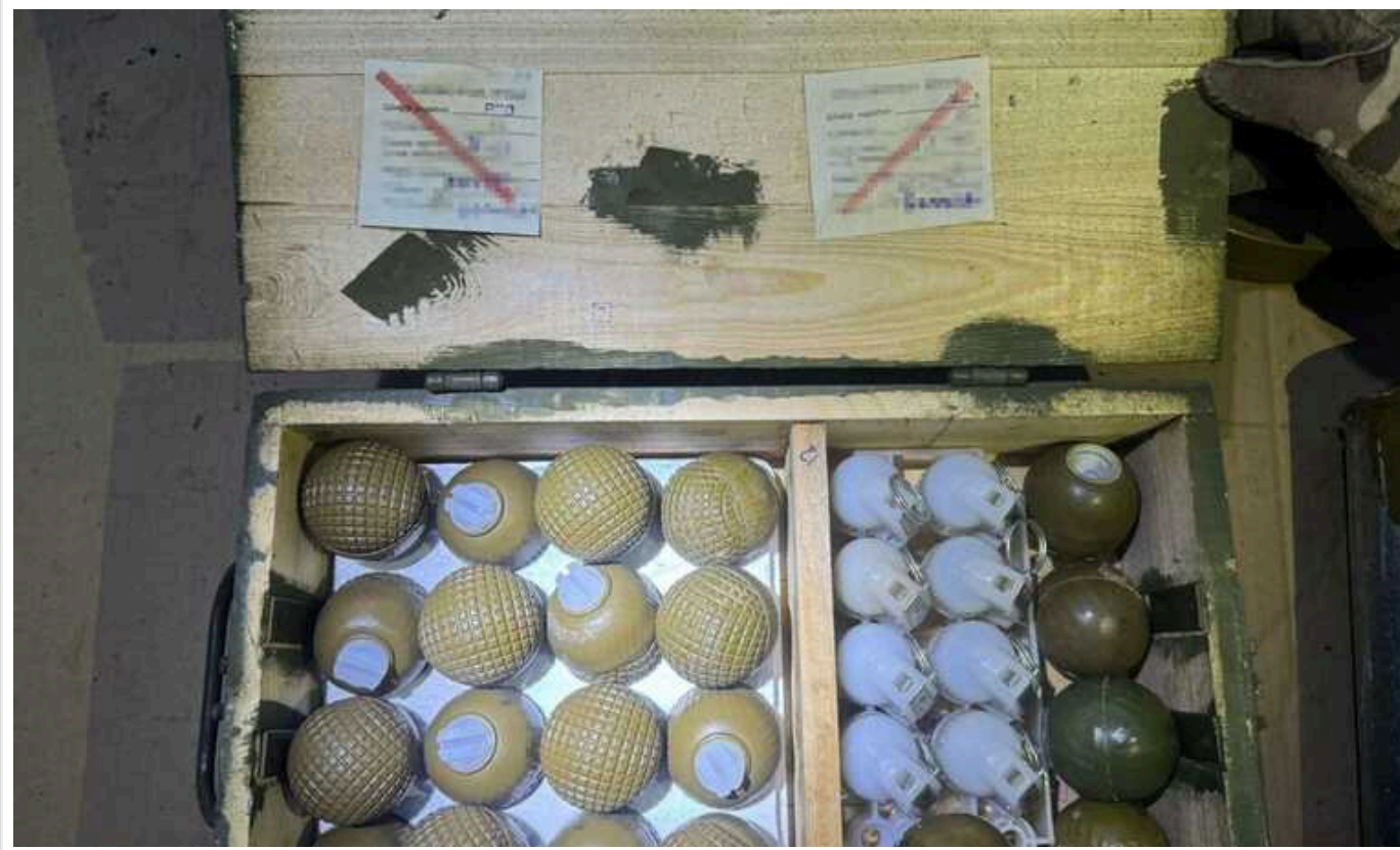
На Донеччині та Харківщині затримали "чорних зброярів", які продавали криміналітету трофейну снайперську зброю та вибухівку

Затримано 5 жителів Дніпровщини та Харківщини, які підпільно торгували трофейним озброєнням та боєприпасами.