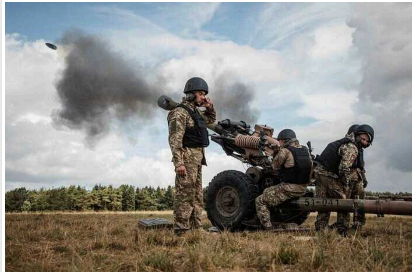
Підрозділи ЗСУ відійшли "на більш вигідні позиції" в районах Лук'янців і Вовчанська, - Генштаб

Генштаб ЗСУ повідомляє про переміщення підрозділів в районах Лук'янців та Вовчанська.