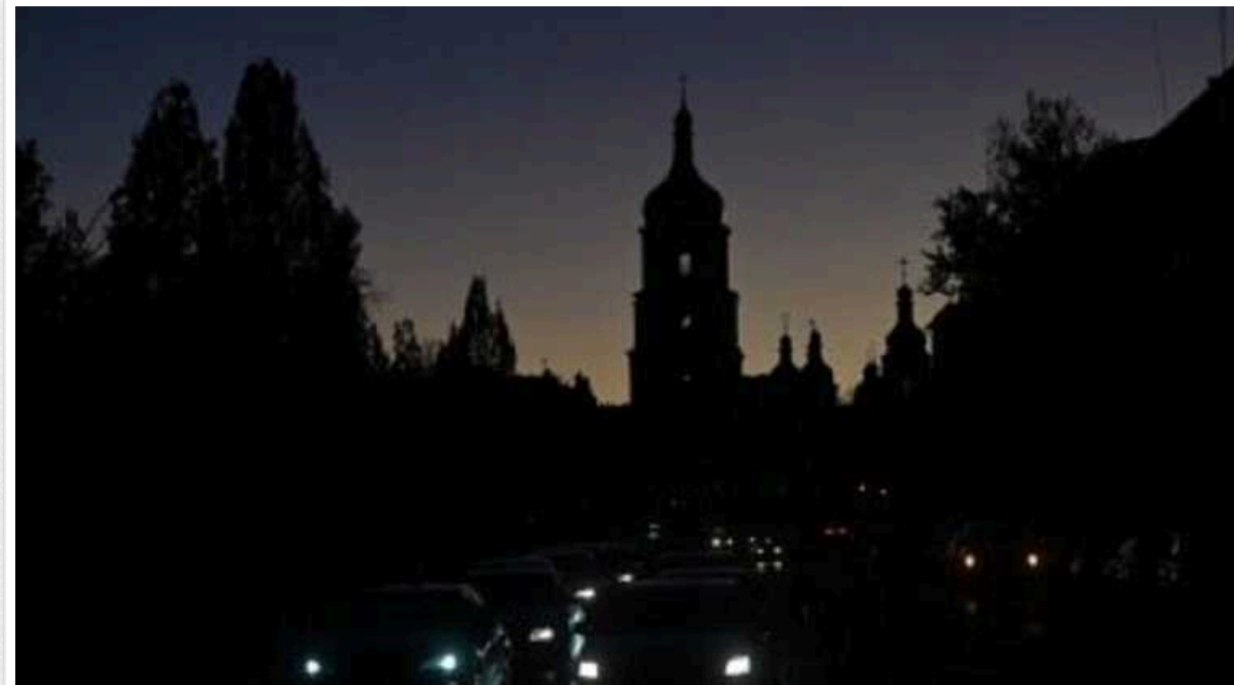
На лівому березі Києва та на Оболоні, як і раніше, немає світла попри обіцянки КДВА

Незважаючи на обіцянку КДВА про включення о 23:00, світла в будинках на лівому березі Києва та на Оболоні, як і раніше, немає.