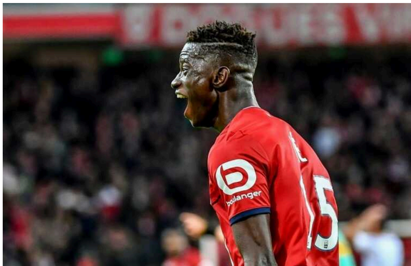
Екстровець "Барселони" підписав контракт із румунським «Динамо» та відправив замість себе брата-близнюка, ЗМІ