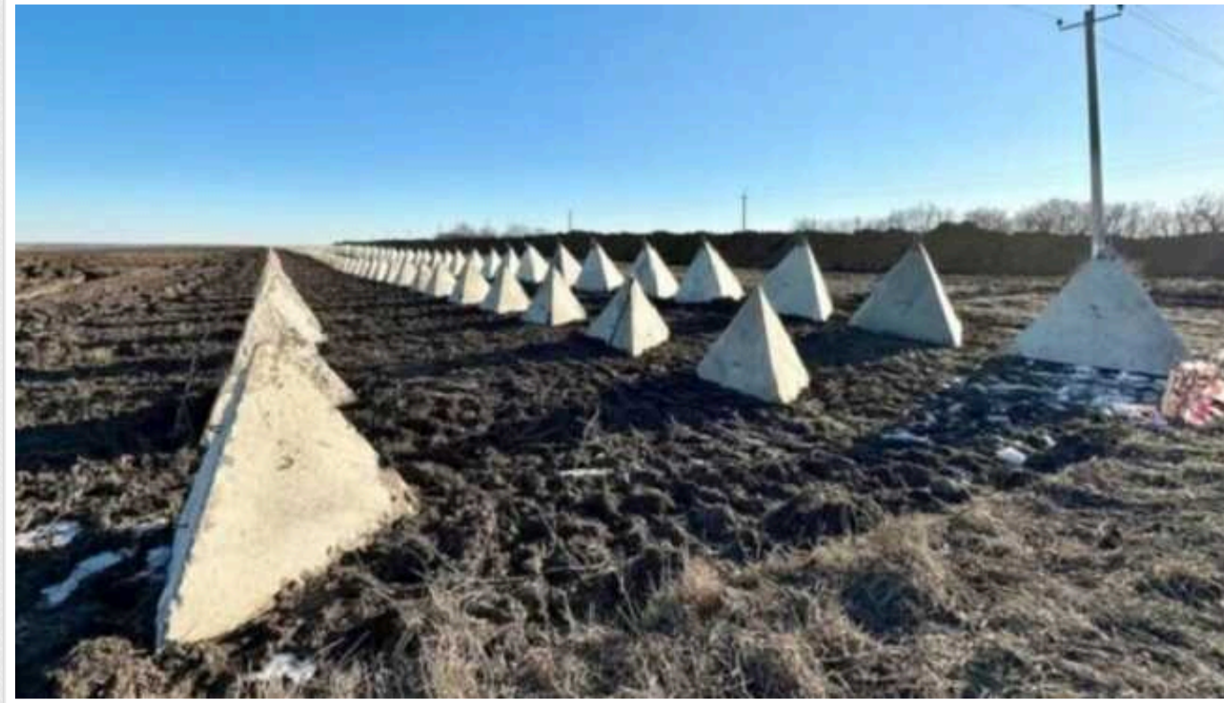
DeepState: На околицях Харківщини з 2023 року лежать без діла "зуби дракона"

"Зуби дракона" просто валяються на околиці Липців на Харківщині, – DeepState.