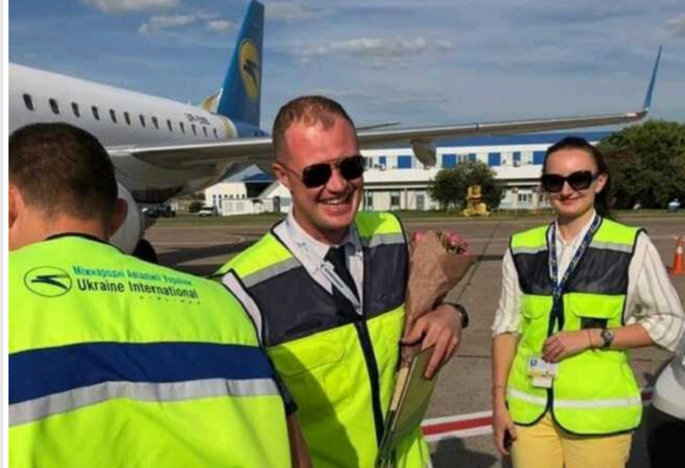
Легалізований спосіб ухилиння від мобілізації: Метод Зайцева

Як ухилитися від призову на військову службу? Сучасні ухилинти мають багато способів, не зрештою використовувати і дітей як інструмент виходу за кордон. Хто своїй, хто всьогонавло багато чужих. Все, аби покинути терени України і легально перебувати в ЄС.