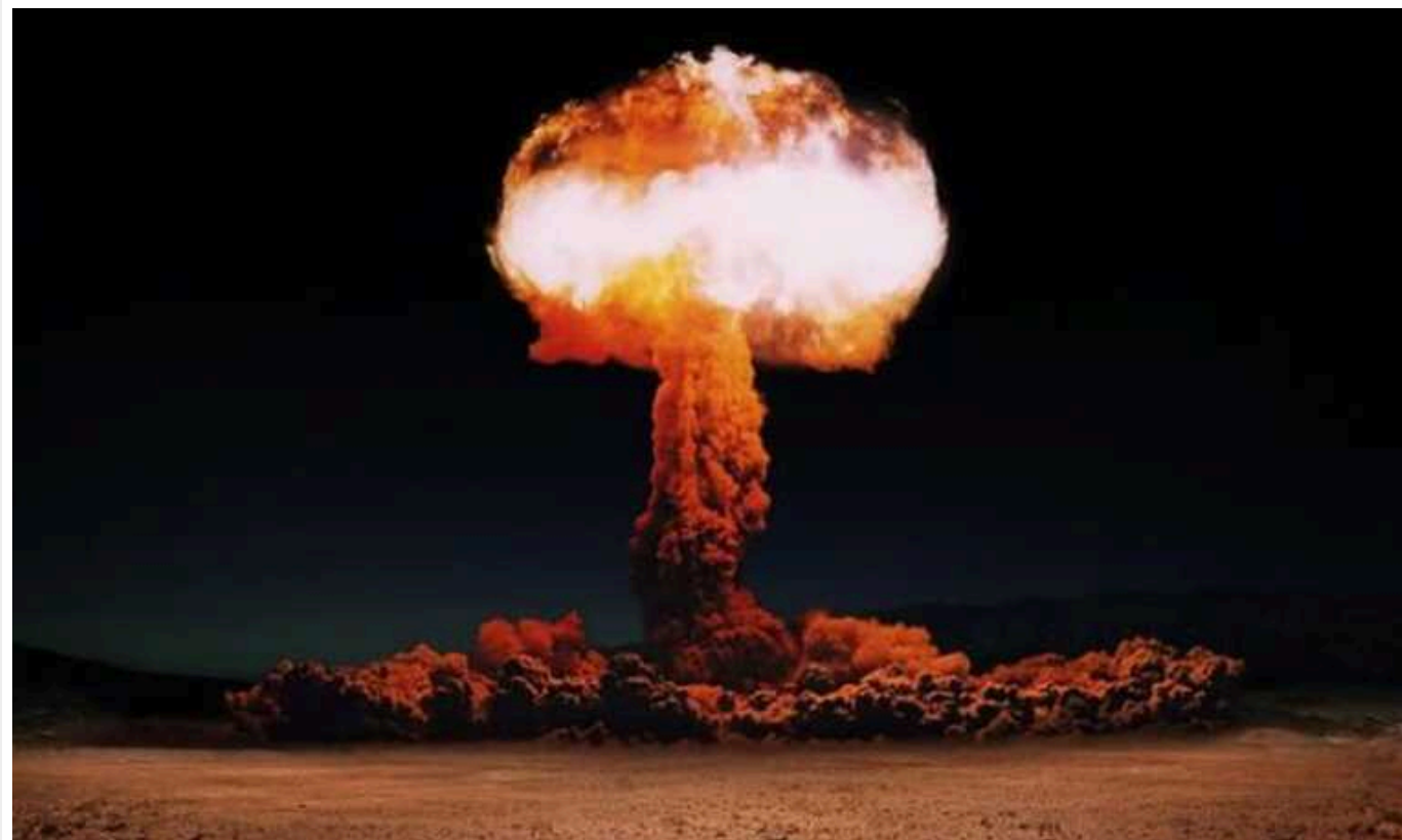
Умова справедливого миру в світі - повна денуклеаризація РФ

Москва і Мінськ продовжують ядерний шантаж, вкотре погрожуючи Заходу ядерною ескалацією, нехтуючи своїми міжнародними зобов'язаннями та інтересами глобальної безпеки.