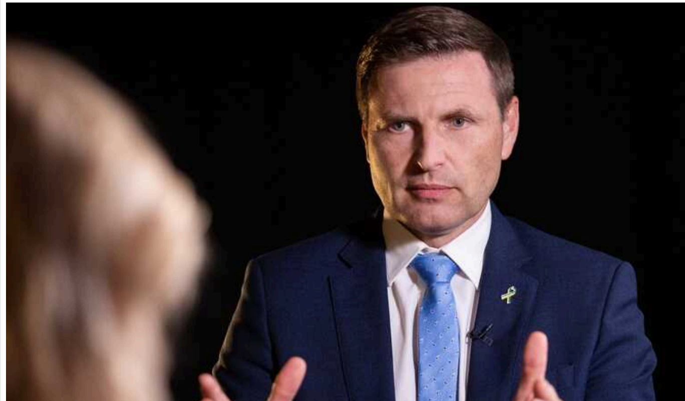
В Естонії сказали, чи планують відправляти війська в Україну: "Дали занадто сміливу інтерпретацію"

Міністр оборони Естонії Ханно Певкур прокоментував інформацію про те, що Таллін нібито розглядає можливість відправлення естонських військових до України. Він заявив, що насправді в естонському уряді не було конкретного обговорення такої можливості й країна не планує "щось робити самотужки".