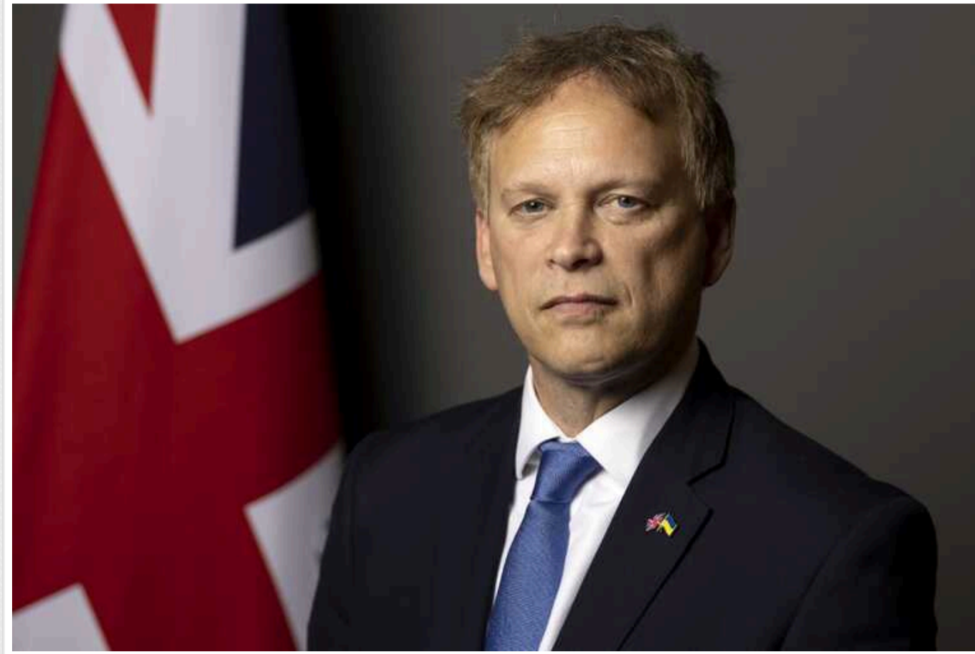
Шаппс заявив, що Велика Британія надавала право Києву бити британськими ракетами в межах території України

Міністр оборони Великої Британії Грант Шаппс фактично дезавував заяву глави МЗС Великої Британії Кемерона про дозвіл бити ракетами по території РФ.