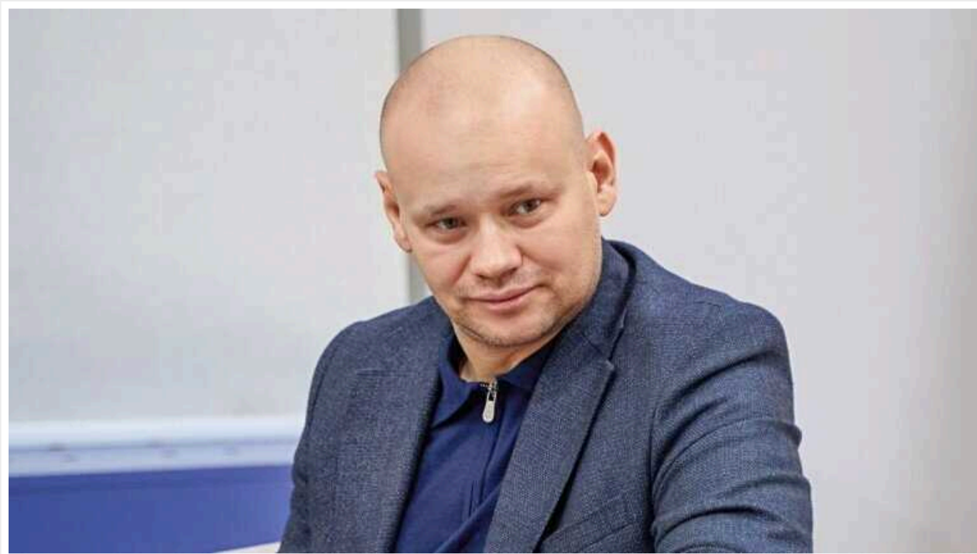
Підозра від НАБУ та невдовзі відставка з ОГП: що відомо про справу Вербицького

НАБУ та САП готуються пред'явити підозри заступнику Генерального прокурора України Дмитру Вербицькому щодо низки корупційних справ, а також незаконного збагачення після публікації розслідування журналістів проєкту «Схеми» від «Радіо Свобода» та зібраних корупційних фактів.