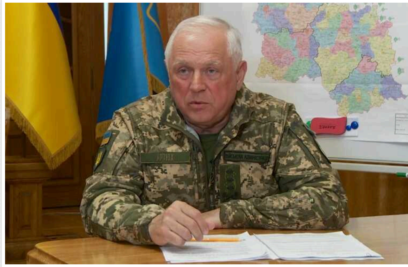
З Сумщини, де можливий наступ окупантів, проводиться евакуація населення, - ОВА

Про це повідомив начальник Сумської обласної військової адміністрації Володимир Артюх.