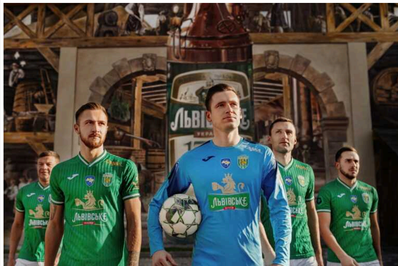
ФК «Карпати» отримав право на бронювання від мобілізації

Міністерство молоді та спорту визнало львівський футбольний клуб «Карпати» критично важливим для функціонування економіки в час воєнного стану. Відповідно, клуб отримав можливість на бронювання від мобілізації щонайменше 50% військовозобов'язаних працівників.