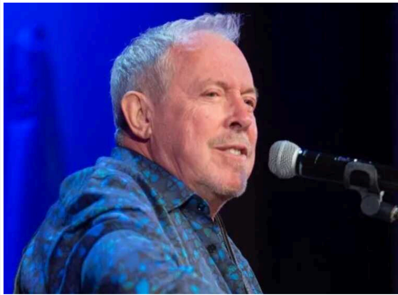
Андрію Макаревичу загрожує арешт у РФ після фейкової розмови із Зеленським

Лідер російського гурту "Машина часу" Андрій Макаревич, який з 2014 року виступає проти путінського режиму, знову обурив росіян. Цього разу він випадково розкрив їм свої наміри виступити в Києві після перемоги України у війні, за що тепер може бути заарештований у РФ щонайменше на два роки.