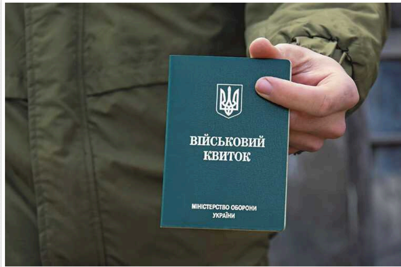
Мобілізація в Україні: в Міноборони розповіли, чи потрібно заброньованим держслужбовцям оновлювати свої дані в ТЦК

Серед категорій громадян України, що мають бронь від мобілізації, є державні службовці. Однак вони також зобов'язані оновити свої дані у ТЦК.