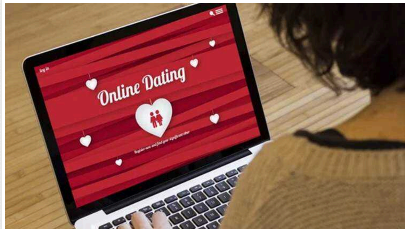
На Тернопільщині жінці присудили штраф за шахрайство на сайті знайомств

Жительці Тернопільщини присудили штраф в розмірі 68 тис. грн за шахрайство на сайті знайомств. Шахрайка зареєструвалася в чоловіків гроші на день народження. Жінка вже не вперше вчиняє подібний злочин. В 2023 році вона отримала також штраф за те, що виманила в залицяльника 54 тис. грн.