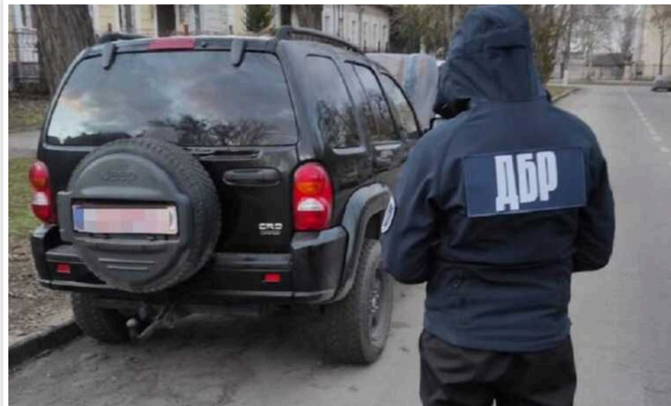
На Миколаївщині будуть судити військовослужбовця за спробу продажу автовок, переданих для ЗСУ

Слідчі Державного бюро розслідувань передали до суду справу військовослужбовця з Миколаївщини, що намагався продати 3 автомобілі, які передали для потреб Збройних сил України.