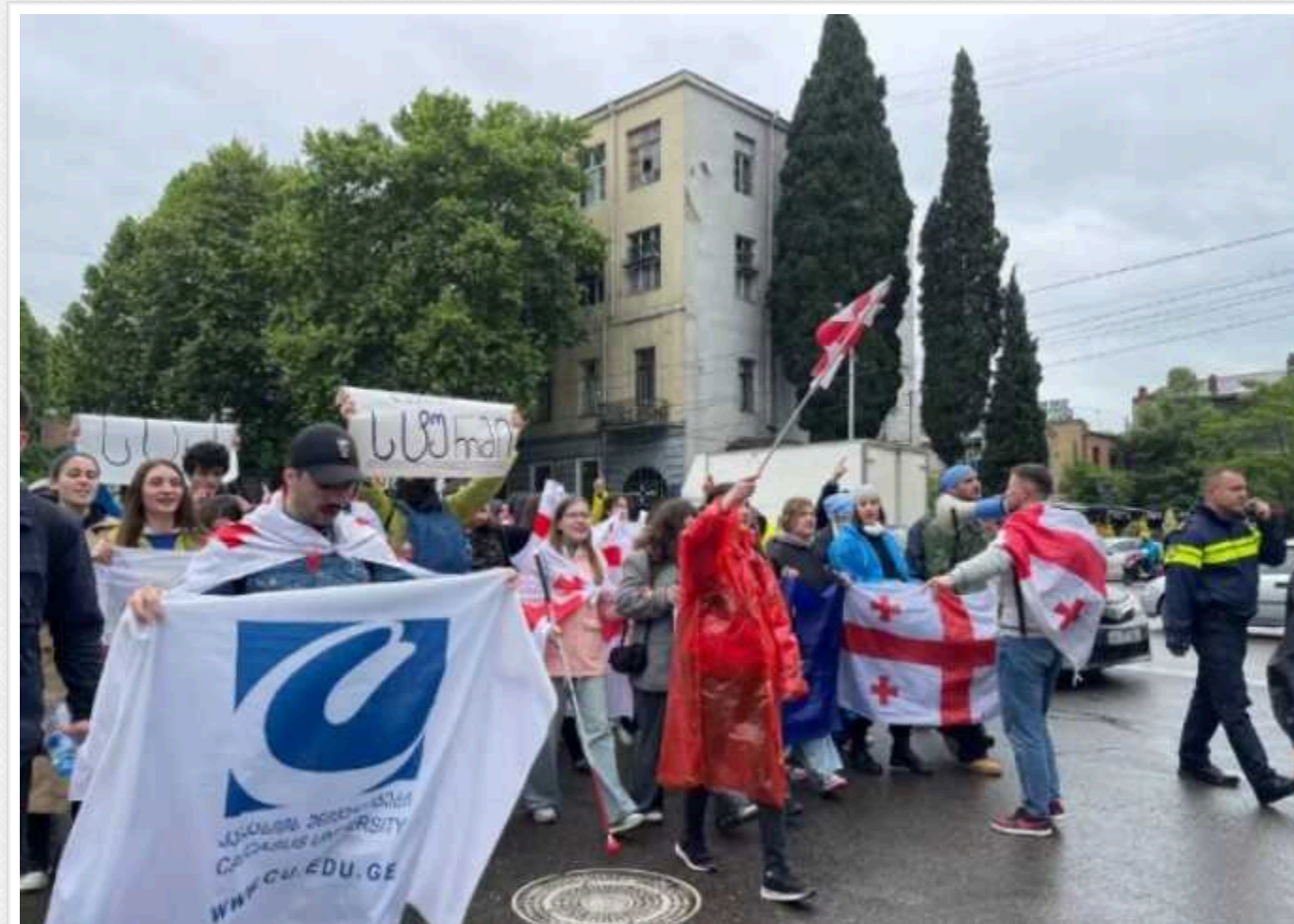
У Грузії противники закону про «іноагентів» збираються біля парламенту

У Тбілісі противники закону про "іноагентів" у вівторок збираються біля будівлі парламенту Грузії, де скандальний документ планують ухвалити в останньому третьому читанні.