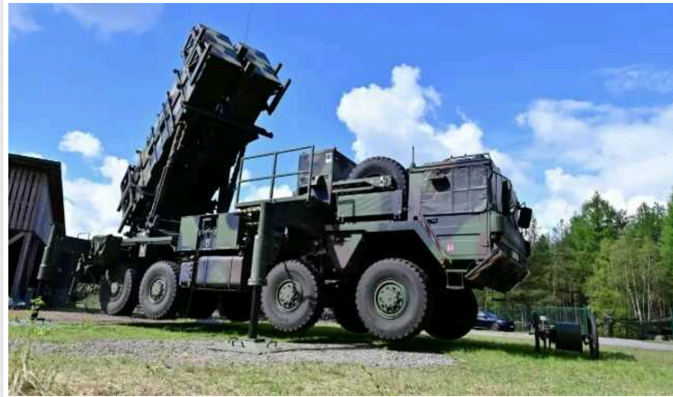
Харкову та області потрібні два Patriot, – Зеленський

Президент України Володимир Зеленський під час зустрічі з держсекретарем США Ентоні Блінкеном наголосив, що для захисту Харкова й області необхідні два додаткові зенітно-ракетні комплекси Patriot.