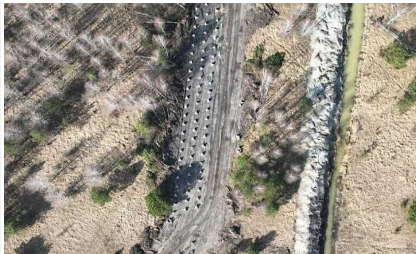
На облаштуванні фортифікаційних споруд у Бучанському районі вкрали 10 мільйонів гривень

СБУ передала до Києво-Святошинської окружної прокуратури інформацію про те, що службові особи Київської ОВА причетні до розтрати бюджетних коштів під час виконання підрядних робіт щодо влаштування фортифікаційних споруд на території Бучанського району.