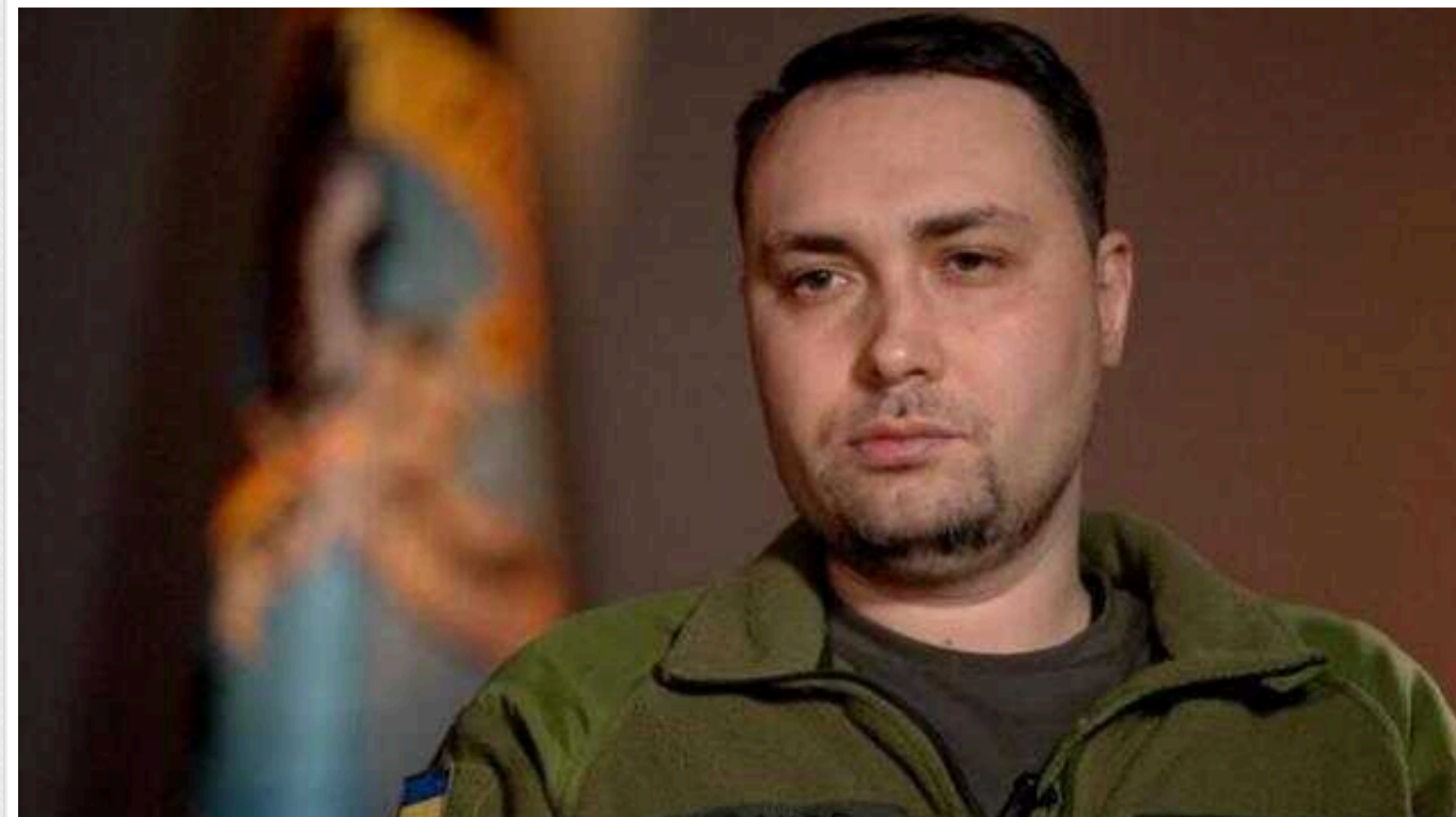
У ГУР припускають, що після Харківської області Росія може піти у напрямку Сум

Українські війська зможуть зміцнити свої позиції та стабілізувати фронт у Харківській області протягом наступних кількох днів. Але Росія розпочне новий наступ далі на північ від Харкова, у Сумській області.