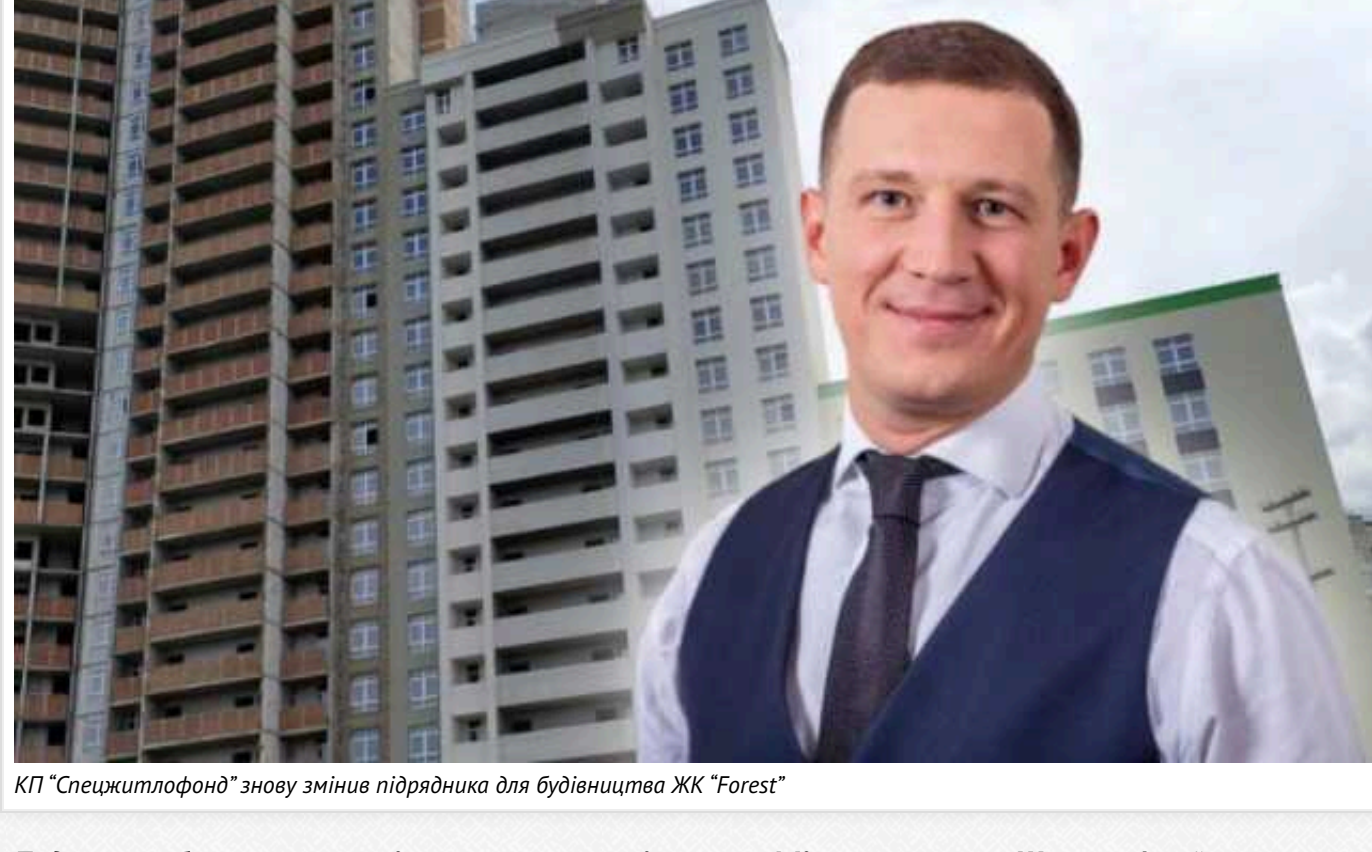
КП "Спецжитлофонд" знову змінив підрядника для будівництва ЖК "Forest"

Будівництво багатопверхової на перетині вулиць Мілотенка та Шолом-Алейхема на Півному масиві столиці (ЖК "Forest"), куди керівництво Києва давно обіцяє переселити мешканців так званого "будинку-вбивці", надалі буде ТОВ "Смарт Універсал Груп".