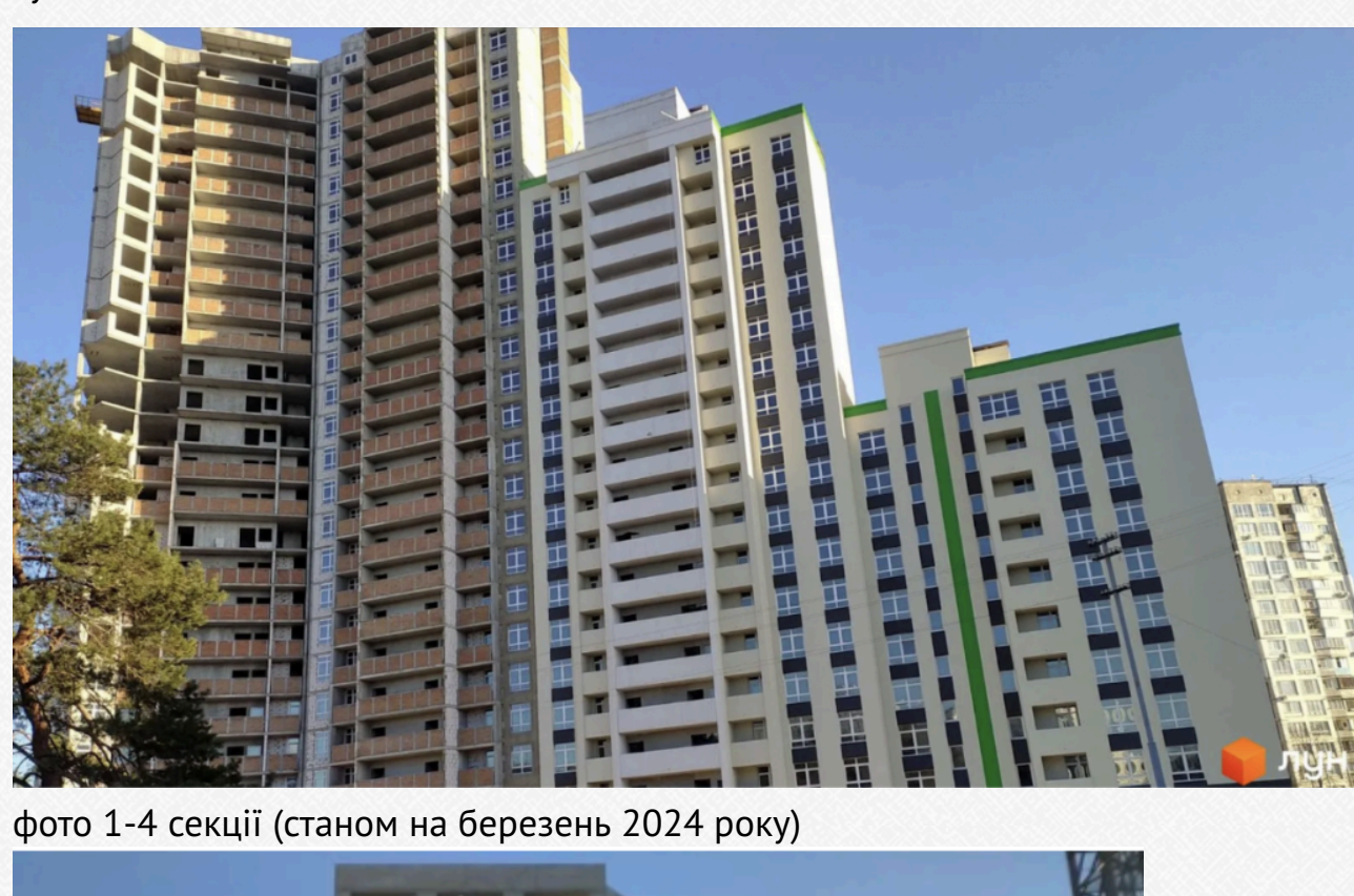
фото 1-4 секції (станом на березень 2024 року)

За інформацією ЛУН, станом на зараз 1 секція є збудованою, заявлена дата вводу в експлуатацію 2 квартал 2024 року. Решта 4 секції мають статус "будівництво зупинено".