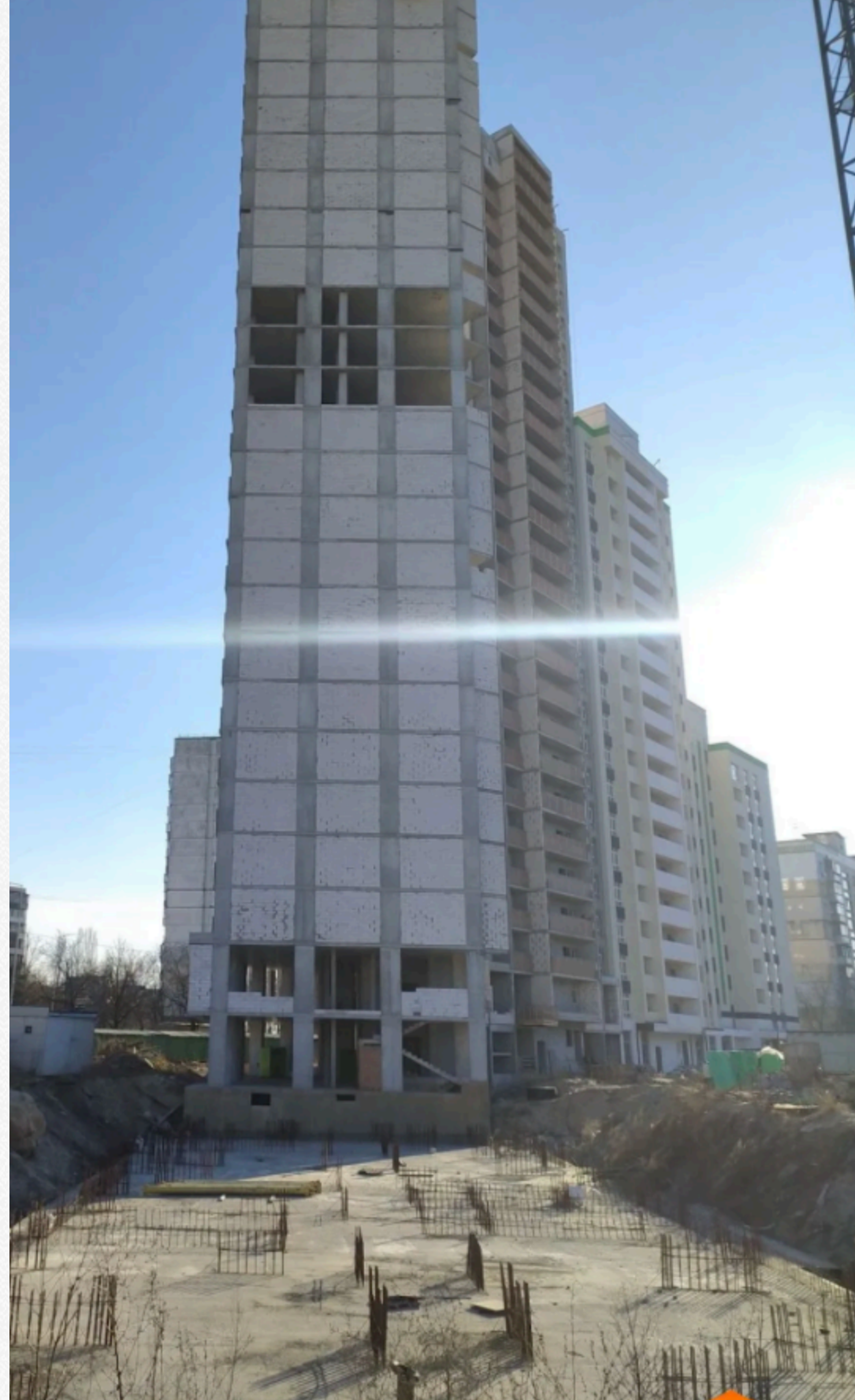
фундамент 5 секції (станом на березень 2024 року)

Згідно з даними публічного модуля аналітики BI.Prozorro, з 2016 року КП "Спецжитлофонд" уклало вже 63 договори в рамках реалізації проєкту цього будівництва. Загальна ціна цих договорів становила 1,24 млрд гривень, однак в процесі виконання ціну деяких з них змінювали, а частину договорів – розривали з нульовою оплатою.