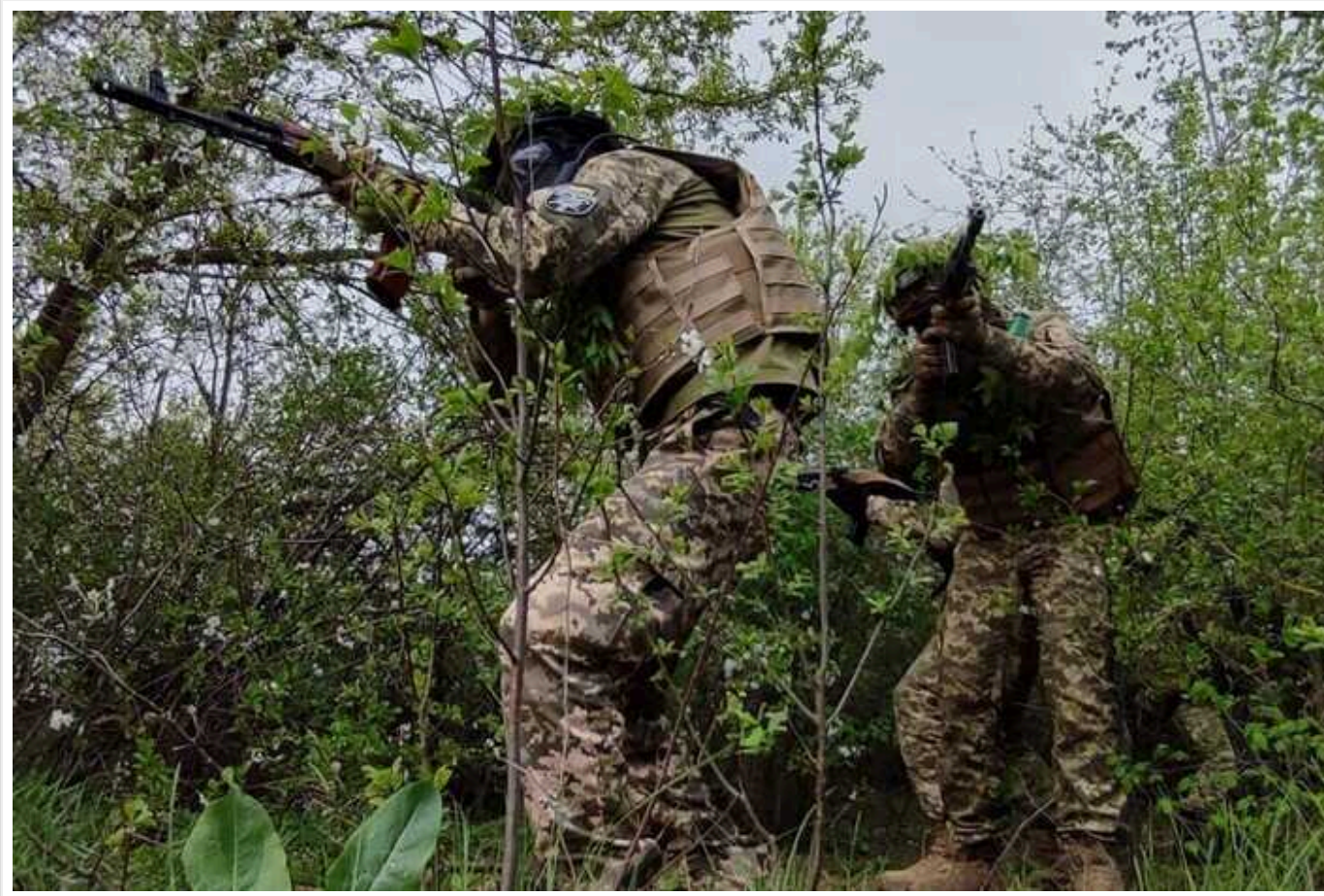
Ситуація на фронті: Сили оборони України зупинили просування окупантів у районі населеного пункту Лук'янці на Харківщині