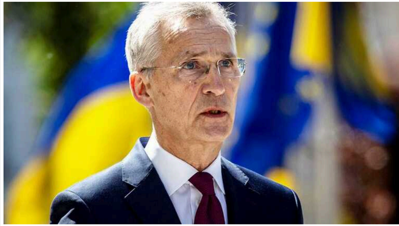
Генсек НАТО вважає, що якщо Україна зазнає поразки, відновлювати її не буде сенсу

Країни НАТО братимуть участь у відбудові України та у розвитку її безпекових та оборонних структур, але наразі найбільш невідкладним завданням є підтримати Україну у її боротьбі проти російської агресії.